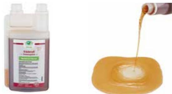
Gebindegröße: 1000 ml-Flasche

Die genauen Daten entnehmen Sie bitte der Deklaration des jeweiligen Produktes.