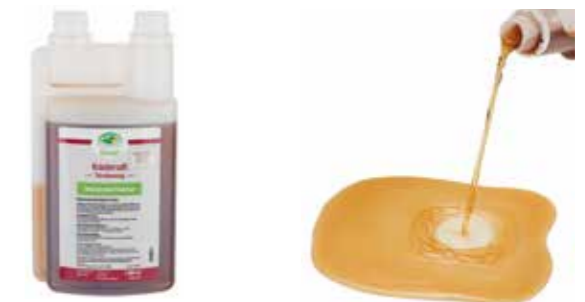
Gebindegröße: 1000 ml-Flasche

Die genauen Daten entnehmen Sie bitte der Deklaration des jeweiligen Produktes.