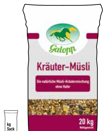
Gebindegröße: 20 kg-Papiersack