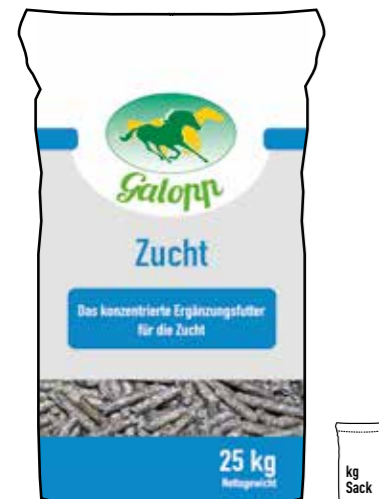
Gebindegröße: 25 kg-Papiersack

Die genauen Daten entnehmen Sie bitte der Deklaration des jeweiligen Produktes.