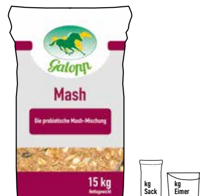
Gebindegröße: 15 kg-Papiersack

Die genauen Daten entnehmen Sie bitte der Deklaration des jeweiligen Produktes.