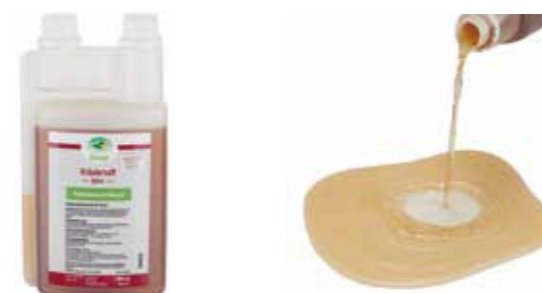
Gebindegröße: 1000 ml-Flasche

Die genauen Daten entnehmen Sie bitte der Deklaration des jeweiligen Produktes.