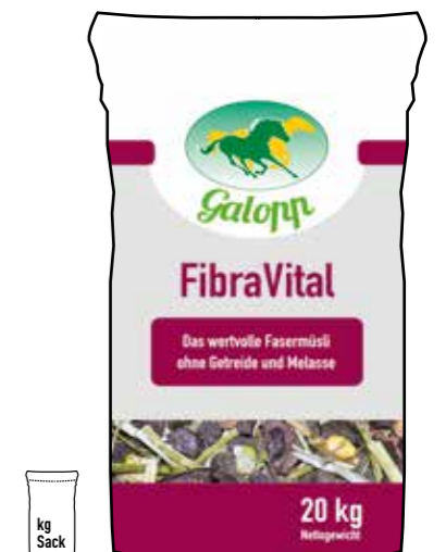
Gebindegröße: 20 kg-Papiersack