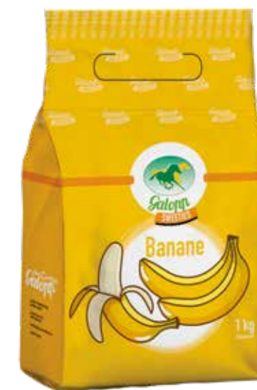
Gebindegröße: 1 kg-Beutel