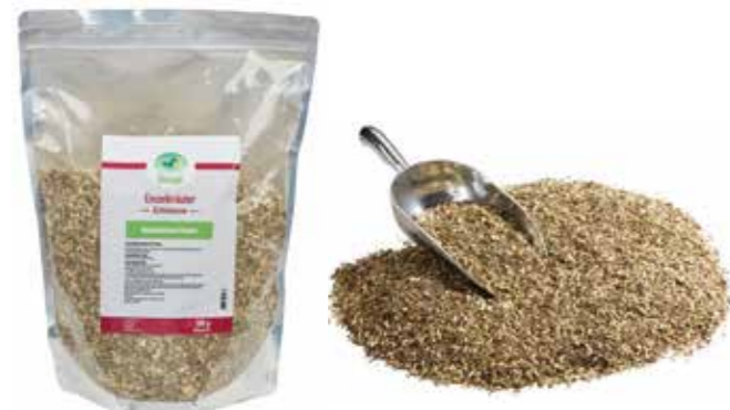
Gebindegröße: 500 g-Beutel

Die genauen Daten entnehmen Sie bitte der Deklaration des jeweiligen Produktes.