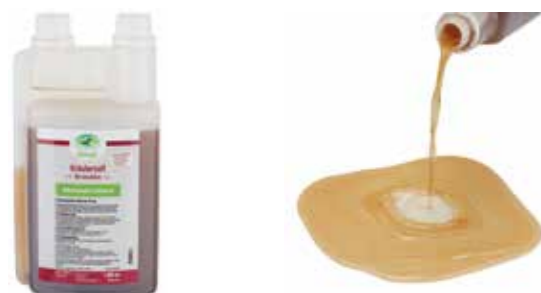
Gebindegröße: 1000 ml-Flasche

Die genauen Daten entnehmen Sie bitte der Deklaration des jeweiligen Produktes.