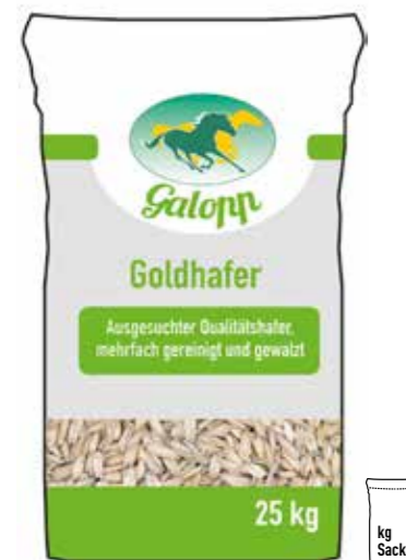
Gebindegröße: 25 kg-Papiersack

Die genauen Daten entnehmen Sie bitte der Deklaration des jeweiligen Produktes.