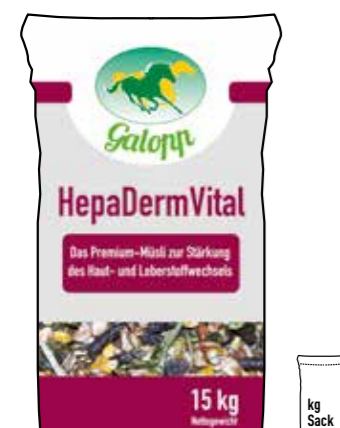
Gebindegröße: 15 kg-Papiersack

Die genauen Daten entnehmen Sie bitte der Deklaration des jeweiligen Produktes.