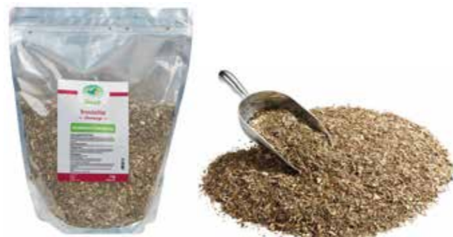
Gebindegröße: 1000 g-Beutel

Die genauen Daten entnehmen Sie bitte der Deklaration des jeweiligen Produktes.