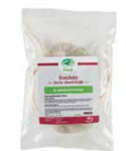
Gebindegröße: 1 kg-Packung

Die genauen Daten entnehmen Sie bitte der Deklaration des jeweiligen Produktes.