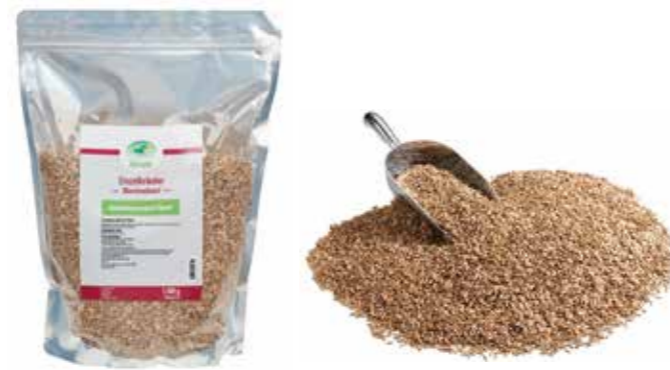
Gebindegröße: 1500 g-Beutel

Die genauen Daten entnehmen Sie bitte der Deklaration des jeweiligen Produktes.