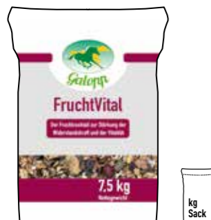
Gebindegröße: 7,5 kg-Papiersack