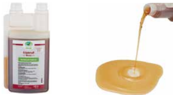
Gebindegröße: 500 ml-Flasche

Die genauen Daten entnehmen Sie bitte der Deklaration des jeweiligen Produktes.