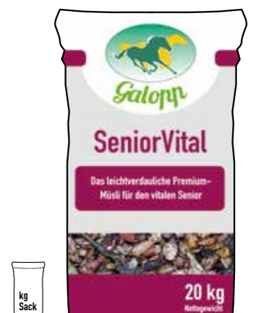
Gebindegröße: 20 kg-Papiersack

Die genauen Daten entnehmen Sie bitte der Deklaration des jeweiligen Produktes.