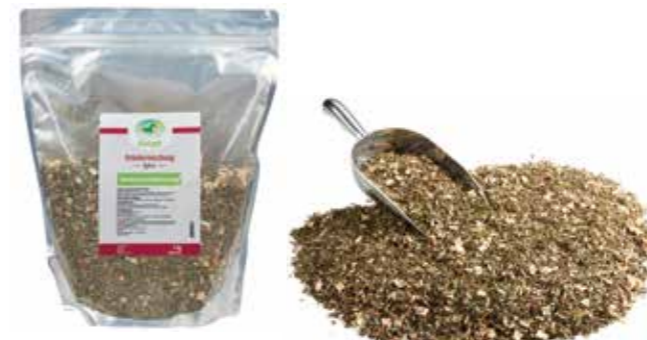
Gebindegröße: 1000 g-Beutel

Die genauen Daten entnehmen Sie bitte der Deklaration des jeweiligen Produktes.