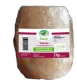
Gebindegröße: 2 kg-Packung

Die genauen Daten entnehmen Sie bitte der Deklaration des jeweiligen Produktes.