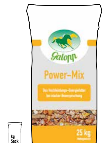
Gebindegröße: 25 kg-Papiersack