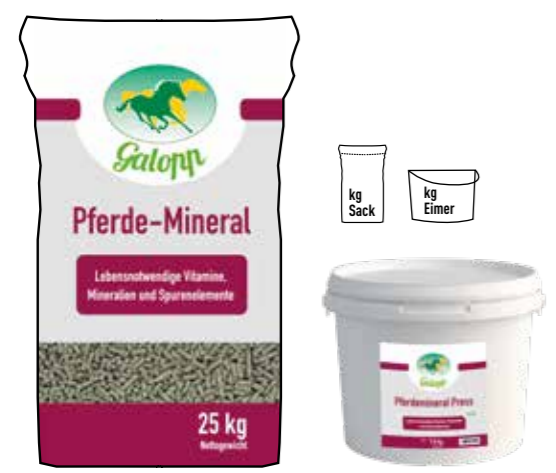
Gebindegröße: 25 kg-Papiersack 7 kg-Eimer

Die genauen Daten entnehmen Sie bitte der Deklaration des jeweiligen Produktes.