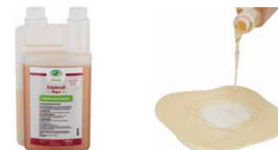
Gebindegröße: 1000 ml-Flasche

Die genauen Daten entnehmen Sie bitte der Deklaration des jeweiligen Produktes.