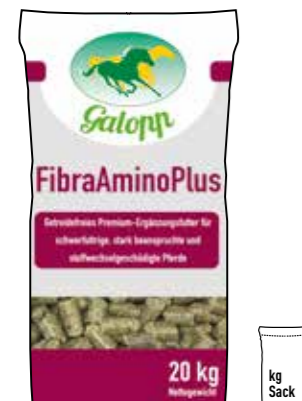
Gebindegröße: 20 kg-Papiersack

Die genauen Daten entnehmen Sie bitte der Deklaration des jeweiligen Produktes.