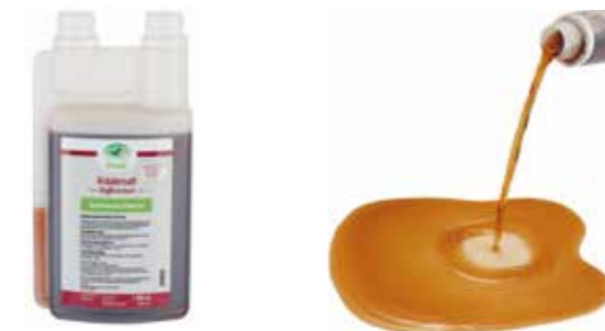
Gebindegröße: 1000 ml-Flasche

Die genauen Daten entnehmen Sie bitte der Deklaration des jeweiligen Produktes.