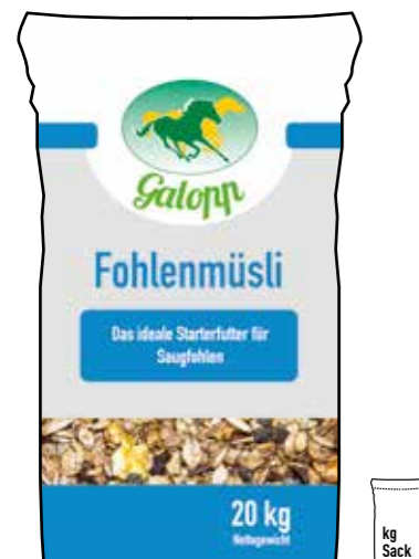
Gebindegröße: 20 kg-Papiersack

Die genauen Daten entnehmen Sie bitte der Deklaration des jeweiligen Produktes.