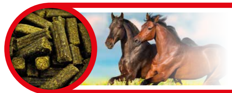
Gebindegröße: 1 kg-Beutel