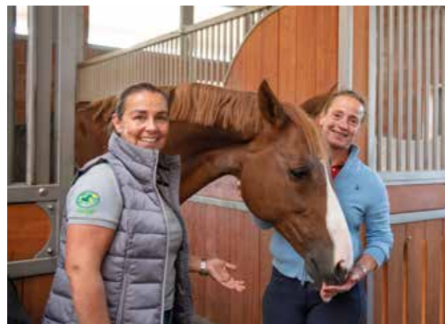
Zu Besuch bei Weltpferd Bella Rose.

Isabell Werth: Der Paddock ist bei uns tägliche Pflicht. Der Weidegang ist bei uns wetter- und charakterabhängig. Wir versuchen sehr individuell vorzugehen und zu schauen, was für die Pferde am besten ist. In der Hochsaison lassen wir die Topferde nur auf die Paddocks gehen und zusätzlich werden sie an der Hand gegrast. Wir haben hier leider schwierige Bodenverhältnisse, die es nicht jederzeit zulassen, in der Turnierphase die Pferde stundenlang auf die Weide zu lassen. Der Paddock dagegen ist allwetterfähig.