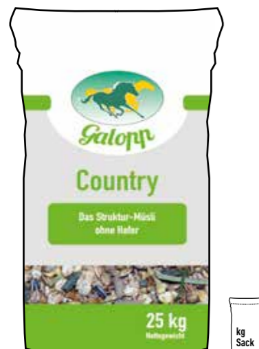
Gebindegröße: 25 kg-Papiersack

Die genauen Daten entnehmen Sie bitte der Deklaration des jeweiligen Produktes.