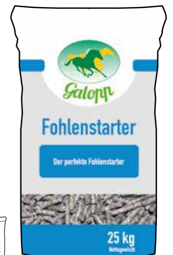
Gebindegröße: 25 kg-Papiersack

Die genauen Daten entnehmen Sie bitte der Deklaration des jeweiligen Produktes.