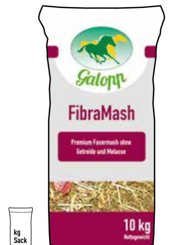
Gebindegröße: 10 kg-Papiersack