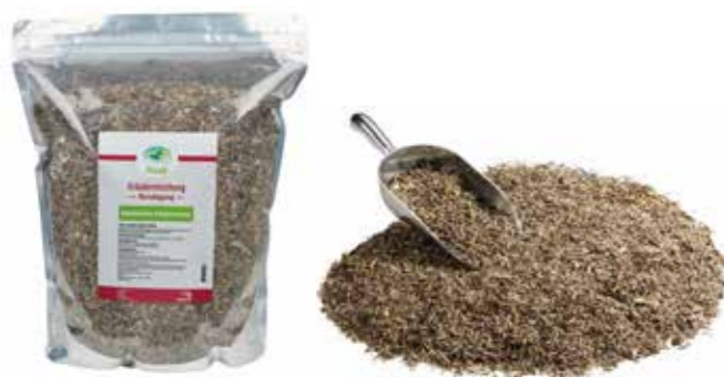
Gebindegröße: 1000 g-Beutel

Die genauen Daten entnehmen Sie bitte der Deklaration des jeweiligen Produktes.