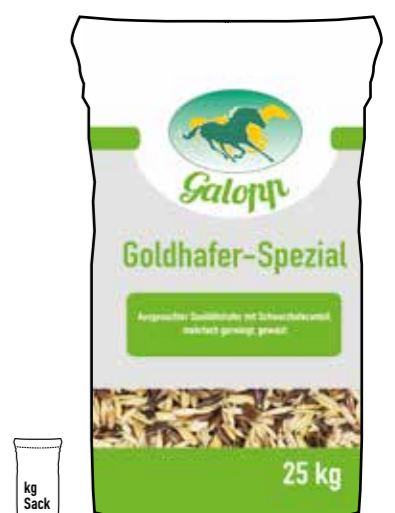
Gebindegröße: 25 kg-Papiersack