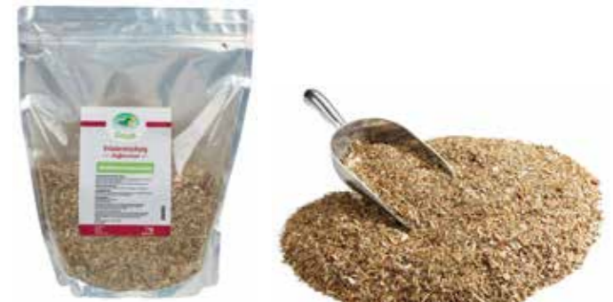
Gebindegröße: 1000 g-Beutel

Die genauen Daten entnehmen Sie bitte der Deklaration des jeweiligen Produktes.