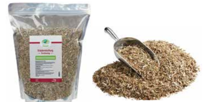
Gebindegröße: 1000 g-Beutel

Die genauen Daten entnehmen Sie bitte der Deklaration des jeweiligen Produktes.