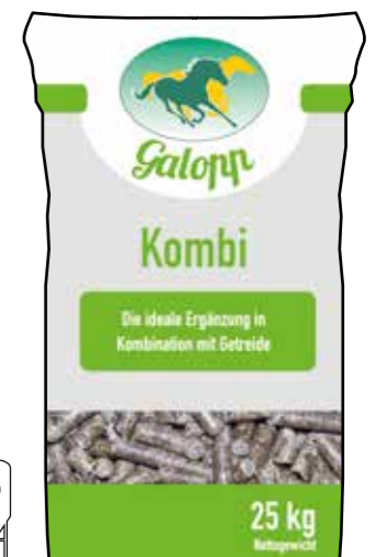
Gebindegröße: 25 kg-Papiersack