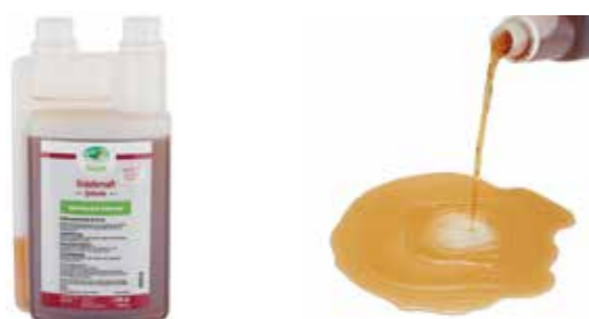
Gebindegröße: 1000 ml-Flasche

Die genauen Daten entnehmen Sie bitte der Deklaration des jeweiligen Produktes.