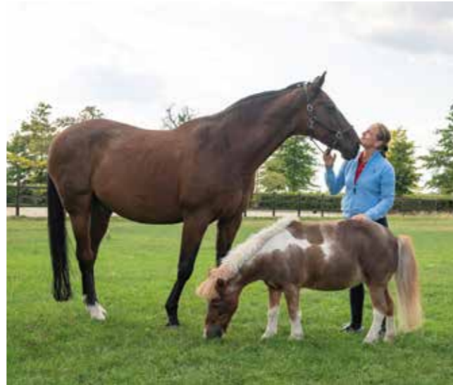
Weltpferd „Satchmo“ (li.), mittlerweile 26 Jahre, lässt es sich auf der Weide gut gehen.

Isabell Werth: Wir haben natürlich ganz unterschiedliche Kandidaten. Wir haben eine Weihgold, die braucht das Futter ähnlich wie ich nur angucken, sie ist so leichtfuttrig und das ist nicht altersbedingt. Andere Pferde, wie Johnny, der wird nie zu fett. Es gibt Pferde, die eine andere Verstoffwechslung haben als andere und daher ist es umso wichtiger, jedes Pferd individuell zu halten. Je leistungsstärker die Situation wird – und es ist nochmal was anderes, ob ich mit einem jungen Pferd eine kleine Prüfung reite oder zum Championat fahre unter extremen Bedingungen, wie 35 bis 40 Grad, extreme Luftfeuchtigkeit und Höchstleistung erfordere – dann habe ich natürlich auch eine andere Anforderung an Futter. Ich arbeite dann sozusagen zu. Die Basis unserer Fütterung ist Galopp-Mix, ein sehr schmackhaftes und hochverdauliches Müsli mit einem hohen Flockenanteil. Die gewünschte Energie kann ich dann mit Hafer noch on Top dazugeben oder auch reduzieren.