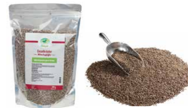
Gebindegröße: 500 g-Beutel

Die genauen Daten entnehmen Sie bitte der Deklaration des jeweiligen Produktes.